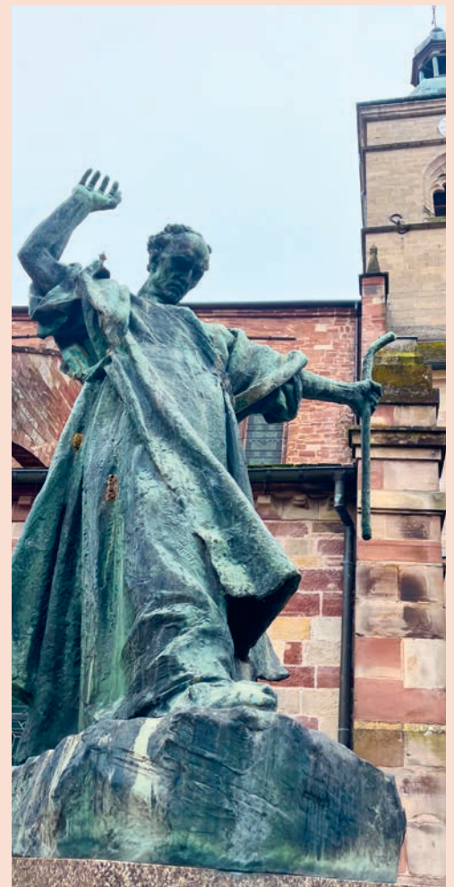
Kolumbansstatue in Luxeuil-les-Bains.