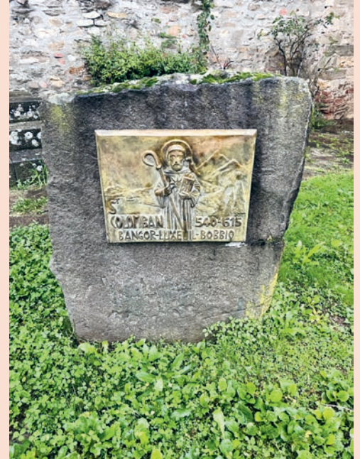
Bangor (Irland) – Luxeuil – Bobbio: Drei wichtige Stationen im Leben des Kolumban.