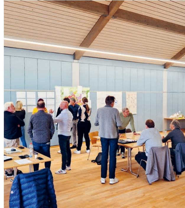
Am Workshop nahmen die Gemeinderatsmitglieder und die Bereichsleitenden teil.