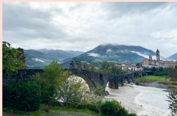
Blick auf Bobbio mit der Ponte Vecchio.