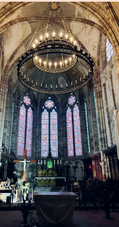
Luxeuil: ehemalige Abteikirche des Klosters, das Kolumban hier in den Vogesen gegründet hat.