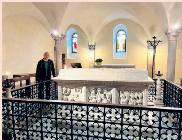
Grab des Kolumban in der Krypta der Basilika San Colombano in Bobbio.