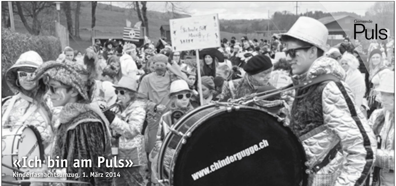
«Ich bin am Puls» Kinderfasnachtsumzug, 1. März 2014