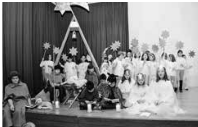
Text: Regula Loher

Die schwungvollen, kindergerechten Weihnachtsmelodien, das Spiel der Kinder und die tief sinnigen Texte der Seniorinnen und Senioren fanden beim Publikum grossen Gefallen. Gleich vier Mal durfte das Krippenspiel aufgeführt werden. Am Seniorennachmittag in St. Konrad erfreuten sich viele ältere Menschen am Spiel der Kinder, und am Samstagmorgen vor Weihnachten kamen Eltern, Verwandte und Bekannte ins St. Konrad, um das Spiel zu geniessen. Am 23. Dezember durften die Kinder dann im Kappelhof mit dem Spiel den Bewohnerinnen und Bewohnern an ihrer traditionellen Weihnachtsfeier eine Freude bringen ... und wie in jedem Jahr überbrachten sie auch im Familiengottesdienst am Heiligen Abend die Weihnachtsbotschaft.