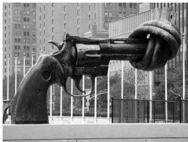
Friedenssymbol bei der UNO New York

Heimat – Reich Gottes – Frieden und Gerechtigkeit