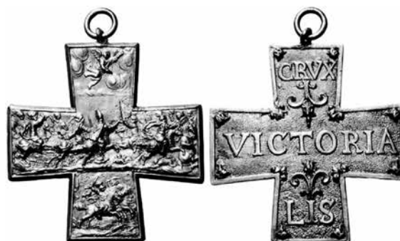
Bild: Ein Ulrichskreuz

Bitte beachten Sie , dass am Samstagabend in St. Konrad kein Gottesdienst stattfindet.