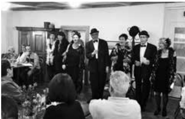
Die Konradsingers im Schlosssali

Am vergangenen Wochenende arbeitete der Kath. Kirchenchor Wittenbach-Kronbühl auf Schloss Dottenwil. Er leistete damit seinen Beitrag zum 15-Jahr-Jubiläum der IG Schloss Dottenwil, wie viele andere Vereine in diesem Jahr auch. Am Samstagabend wurde ein dreigängiges Essen angeboten, das die Vereinsmitglieder selber erstellt und zubereitet haben: Salat, Hackbraten mit Kartoffelstock und Rüepli, Eis-Pavlova mit Himbeersauce. Am Sonntagmittag stand eine Kartoffelsuppe mit Wienerli im Angebot. Auch eine Auswahl an kalten Plättli konnte bestellt werden, ebenso eine kleine Auswahl an Standard-Desserts.