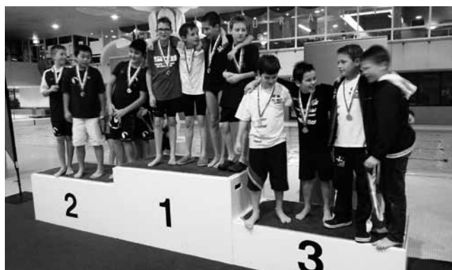
Text und Bilder: SC Wittenbach

U-12 Staffel: 1. Rang, 4x50 m Freistil 2:14.77 (Siebenmann Noel; Toscan Marius; Horvath Levente; Martin Christian)