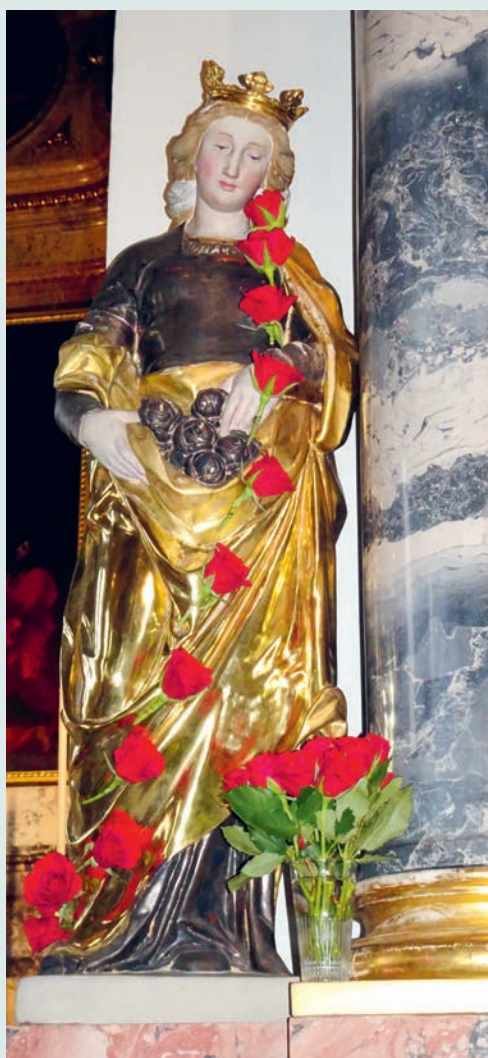
Statue der Heiligen Elisabeth in der Kirche St. Ulrich, Foto von Bernadette Hug.

Samstag, 16. November, um 18.30 Uhr in Häggenschwil; Sonntag, 17. November, um 9.00 Uhr in Muolen