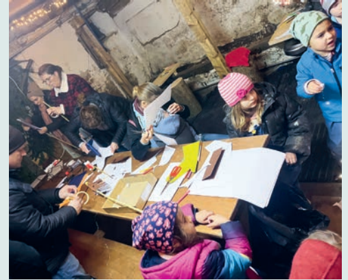
Rösslibasteln im ehemaligen Kuhstall.