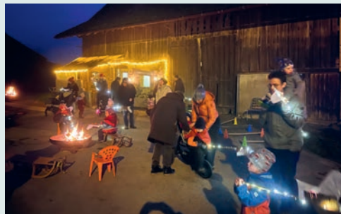
Aufbruch zum Laternenliweg.