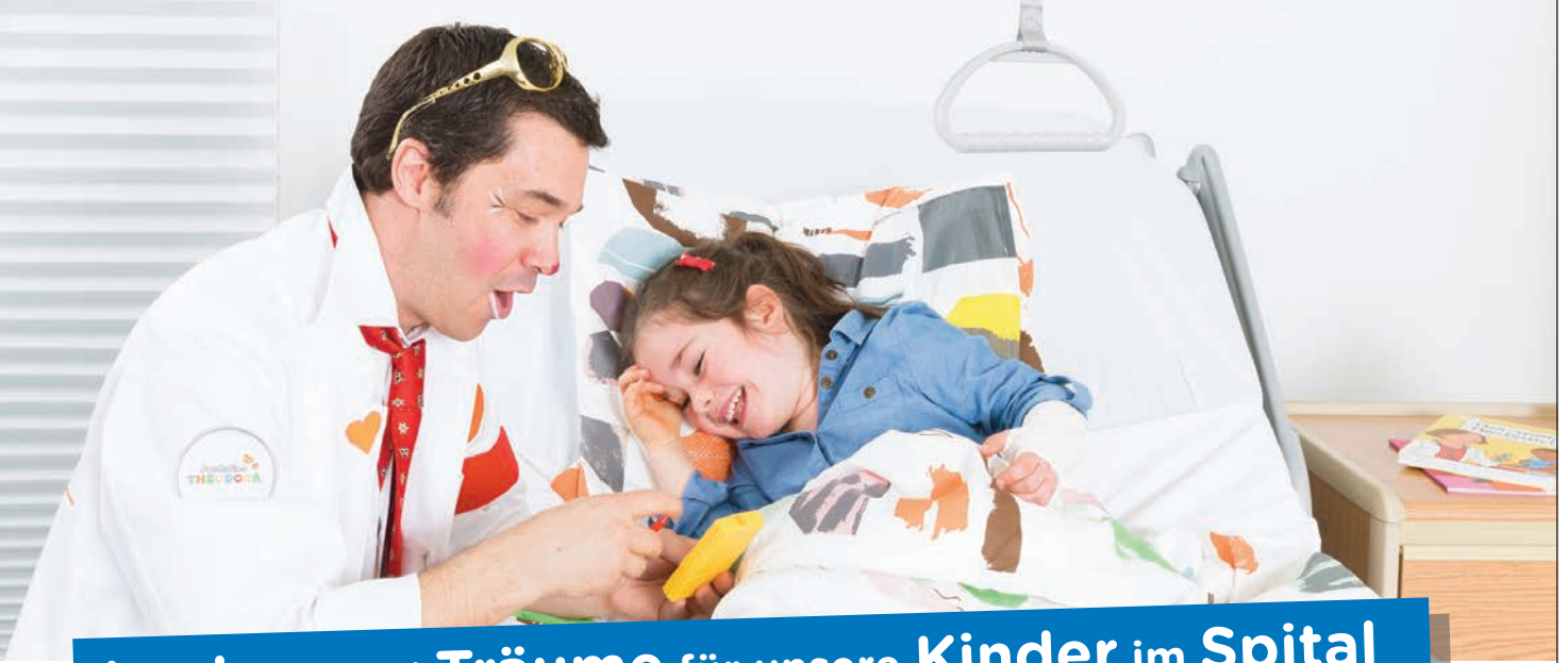
Anzeige offeriert.