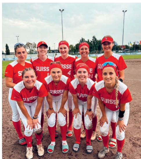
Alle Spielerinnen auf dem Foto sind Spielerinnen der Softballmannschaft NLA Panthers Wittenbach.