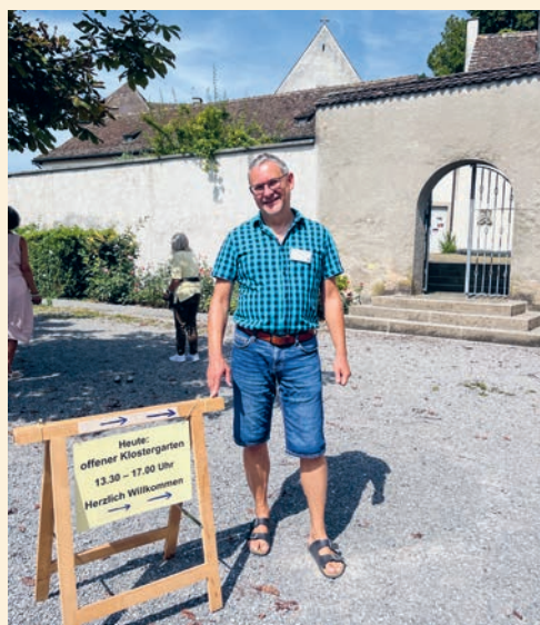
Einmal im Jahr, immer Ende August, bietet sich die Gelegenheit des offenen Klostergartens.