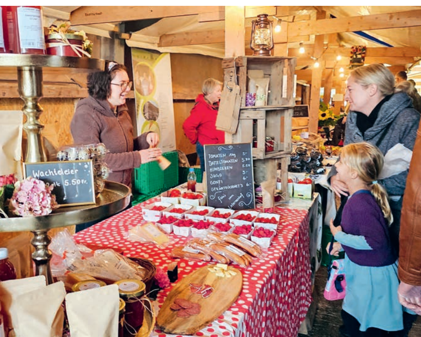
Ein breites Angebot regionaler Produkte wartet auf die Besuchenden.

Der Anlass findet bei jedem Wetter statt. Parkplätze stehen nur sehr reduziert zur Verfügung. Bitte kommen Sie mit dem ÖV, zu Fuss oder per Fahrrad.