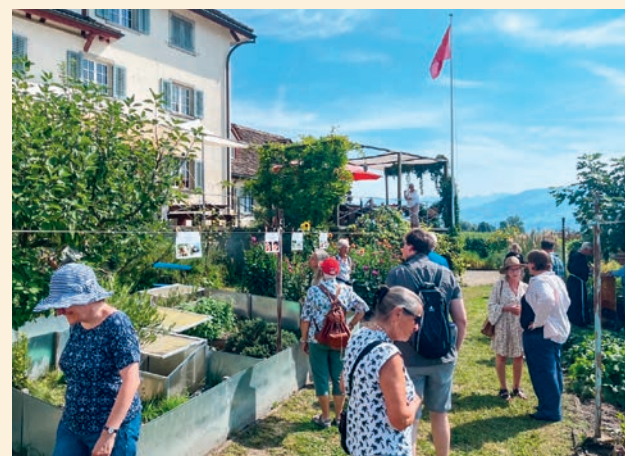
Besucher im Klostergarten