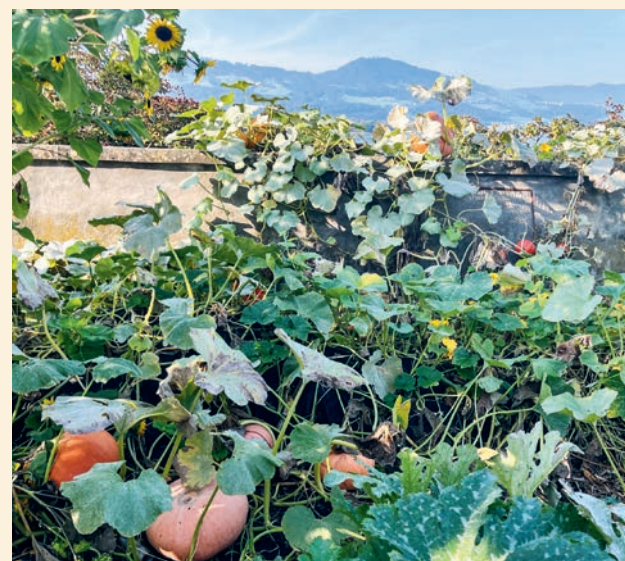
Riesenkäliber von Kürbissen