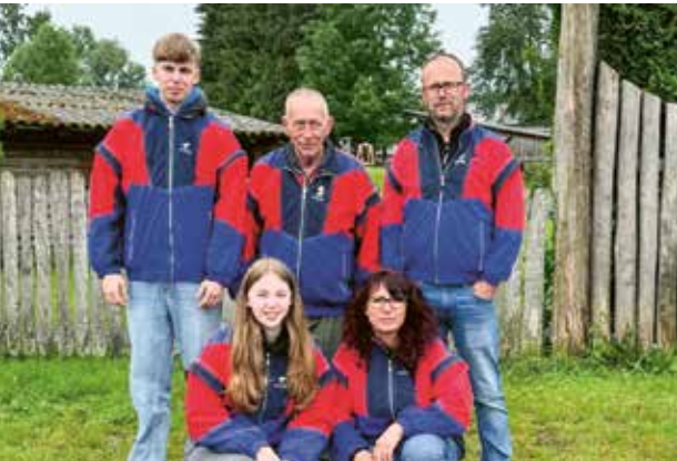
Gruppe E 3 Generationen.