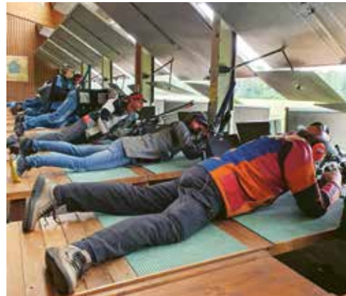
Gruppe Sport beim Schluss-Final.