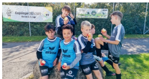
In den Apfelpausen wurde der Energiespeicher aufgefüllt.