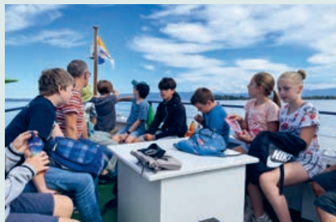
Zwischen Rorschach und Altenrhein Schiffplände

Am Mittwochnachmittag, 20. September, besuchten die Ministrant*innen das Fliegermuseum in Altenrhein, wobei die Anreise per Schiff ab Rorschach erfolgte. Eine stündige Führung durch die Sammlung von verschiedenen Fliegern, aber auch Oldtimer-Autos half, die Ausstellungsstücke besser zu verstehen.