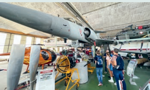
Das schnellste Flugzeug, das die Schweizer Luftwaffe je hatte: die Mirage.