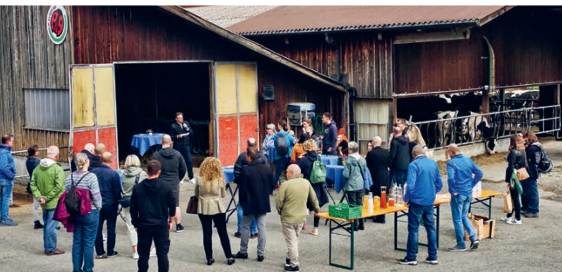
Rund 40 Neuzuzüger*innen liessen sich informieren, genossen den Apéro und besuchten anschliessend den Buurä-Erlebnismarkt.