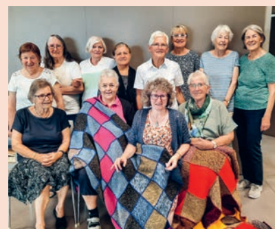
Frauen vom Lismi-Träff

Auch allen fleissigen Strickerinnen kommt ein gebührender Dank zu. Was ihr so still und leise geleistet habt, ist sehr beeindruckend.