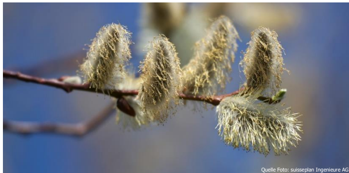
Die Sal-Weide ist bekannt für ihre flauschigen «Kätzchen».