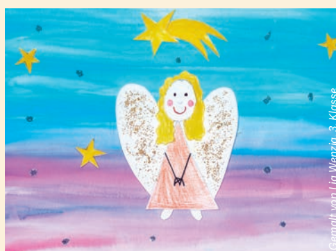
Gemalt von Lia Wenzig, 3. Klasse