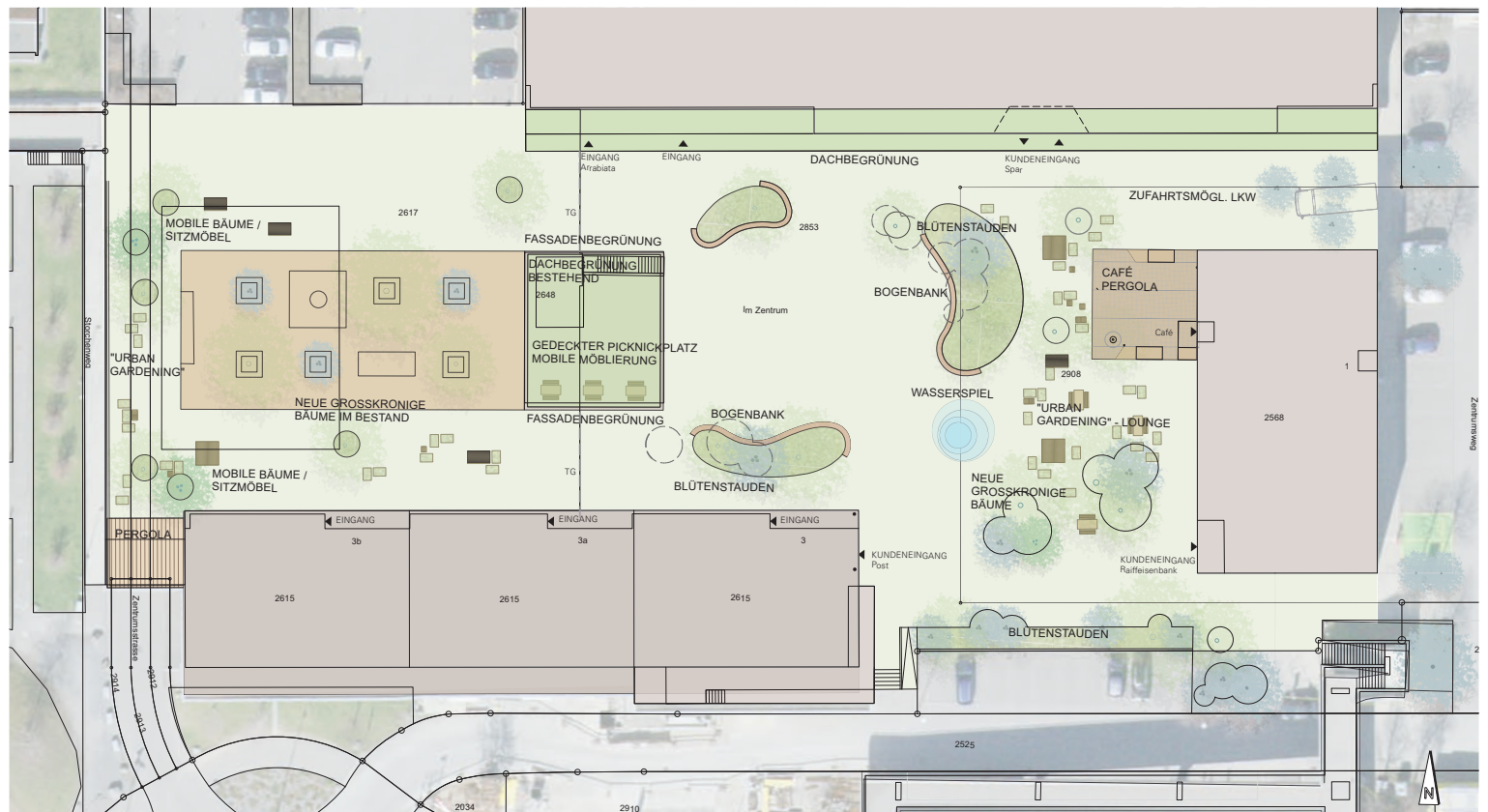
Der Plan zeigt die Vision des Zentrumsplatzes auf, wie er einst aussehen könnte.

Für diese Massnahmen tragen die beiden Grundeigentümer wie bereits in der ersten