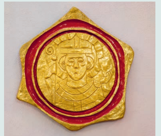
Verkleinerte Kopie des Konradsmedaillons hinten in der Konradskirche