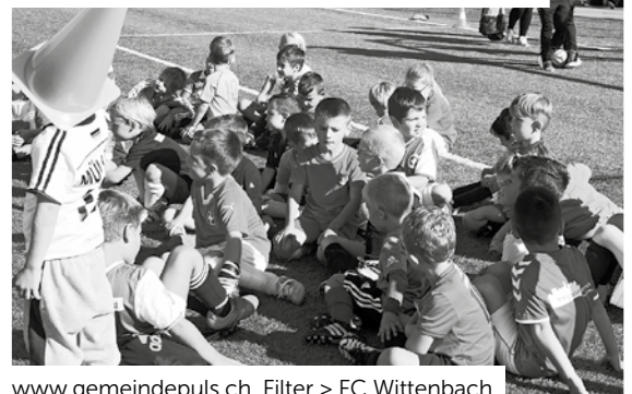
www.gemeindepuls.ch , Filter > FC Wittenbach