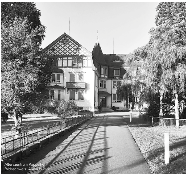
Alterszentrum Kappelhof

In dieser Redewendung spiegelt sich natürlich unter anderem die hohe Arbeitsmoral in Deutschland. Für die Schweiz lässt sich wohl Ähnliches sagen. Jedenfalls finden wir auch in Wittenbach ein vorbildliches Beispiel für obige Tatsache: