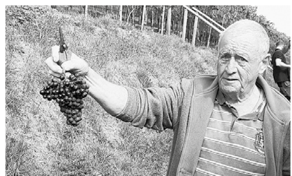
www.gemeindepuls.ch , Filter > IG Schloss Dottenwil

Wo & wann immer du willst: www.gemeindepuls.ch