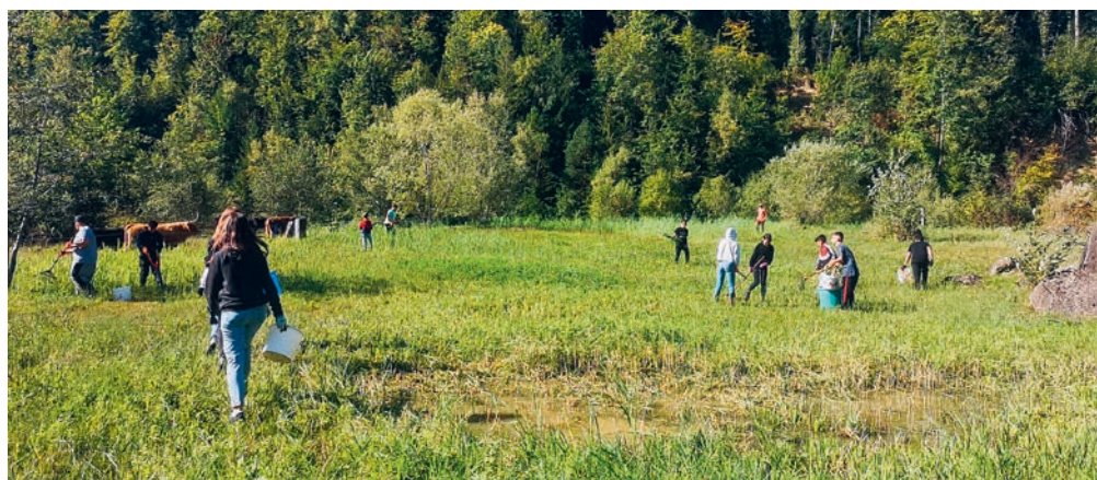
Arbeitseinsatz in der Natur

Das Wochenprogramm wurde so gestaltet, dass der Morgen jeweils im Klassenverband stattfand.