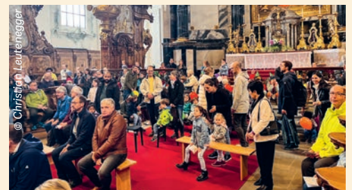
Die Hochaltarstufen, voll mit Familien...