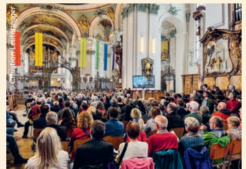
Die Kathedrale, voll von vorne bis hinten