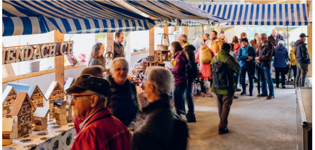
Auch die zweite Durchführung des Buurä Erlebnismarktes zog diverse Besucher*innen an.

Beim Stand des Imkervereins spürten die Besuchenden die Begeisterung der Imker*innen für ihre Leidenschaft rund um die kleinen fleissigen Honigmacherinnen. Beim Markt-