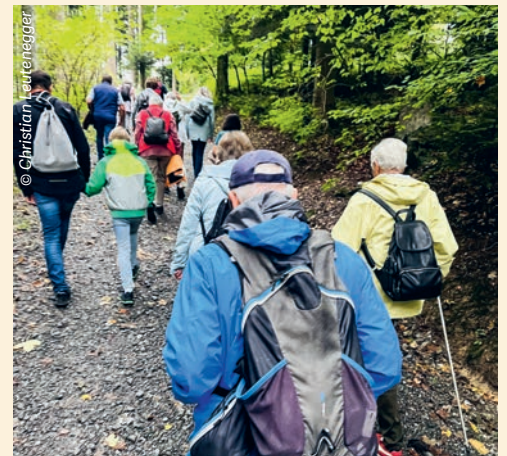
Pilgergruppe kurz vor Peter und Paul