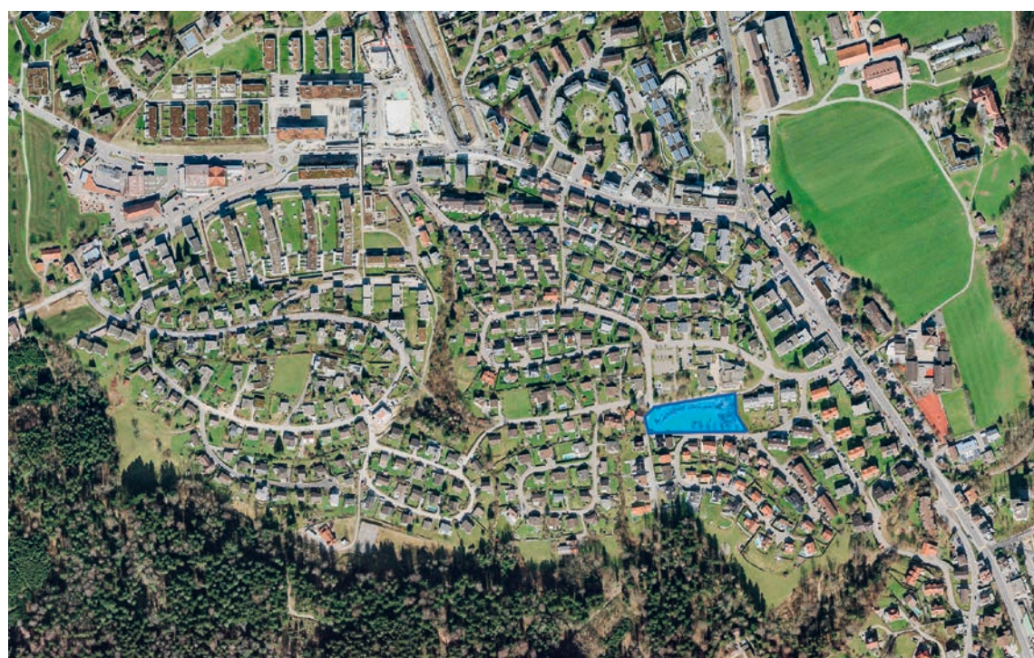
Übersicht Projekt «Böhl»