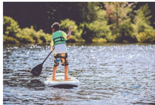
Beim Stand-up-Paddeln lohnt es sich, eine Schwimmweste zu tragen.