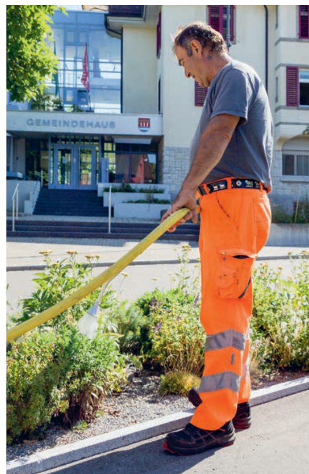
Ein Mitarbeiter des Werkhofs beim Tränken der Rabatten.

Wen es interessiert, wieviel Wasser der eigene Rasensprenger verteilt, kann dies mittels eines Tests messen. Stellen Sie dazu einen Joghurtbecher auf die zu bewässernde Fläche und lassen Sie den Rasensprenger laufen. Ist der Becher 10 Millimeter hoch gefüllt, entspricht dies ca. 10 Litern Wasser pro m 2 . Je nach Bodenbeschaffenheit werden zwischen 10 bis 20 Liter pro Quadratmeter Rasen benötigt.