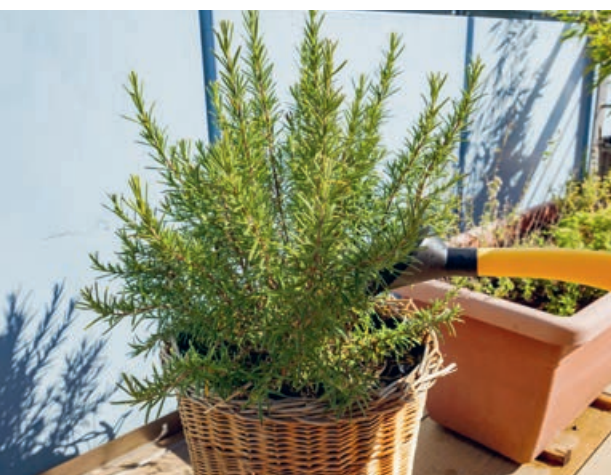
Topfpflanzen brauchen mehr Wasser als Gartenpflanzen.

«Lieber ein- bis dreimal pro Woche lange wässern als täglich nur kurz.»