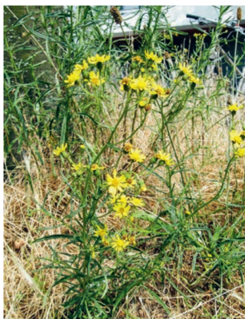
Das Jakobskreuzkraut mag vielleicht hübsch aussehen, gehört aber leider zu den Problempflanzen.