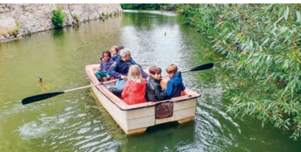
Auch in diesem Jahr geht es mit den drei Gemeindepräsidenten auf die Suche nach den Schlossgeistern...

Vom 16. Mai bis 19. Juni läuft die sogenannte Wunschphase. In dieser Zeit können auf der FerienSpass-Plattform www.ferienspass-wmh.ch die Kurse zwar noch nicht fix gebucht, aber als Wünsche eingegeben werden. Ob der