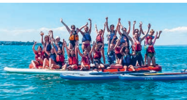
...oder mit dem Stand-up-Paddle auf den Bodensee.

In dieser Woche werden die Flyer an den Primarschulen der drei Gemeinden verteilt.