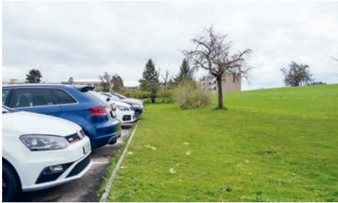
Beim Parkplatz hinter dem Gemeindehaus wird das letzte Stück der Hecke gepflanzt.

Am Samstag, 23. April, heisst es Stiefel montieren, Gartenhandschuhe anziehen und beim Parkplatz hinten beim Gemeindehaus einheimische Büsche und Sträucher pflanzen. Als Belohnung winken Wurst, Brot und Apfelsaft.