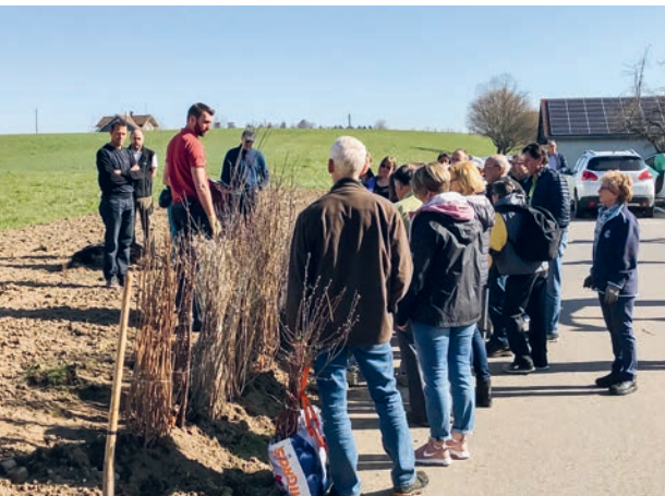
Im Frühjahr 2019 wurde der erste Teil der Hecke gepflanzt, jetzt ist der letzte Teil an der Reihe.