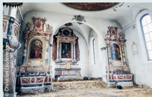
Altarbilder und Ausschnitt eines Deckengemäldes. Zustand am 6. April.