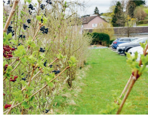
Auch für die restliche Hecke werden verschiedene einheimische Sträucher gepflanzt.

Die aktiven Anwesenden, aber auch jene, die aus reinem Interesse vorbeischaun, können sich mit Wurst, Brot und Apfelsaft stärken. Diese werden den Anwesenden von der Arbeitsgruppe «Grünes Wittenbach» offeriert. Mit einer Wurst in der Hand lohnt es sich, über den Parkplatz zu schlendern und die vorhandenen