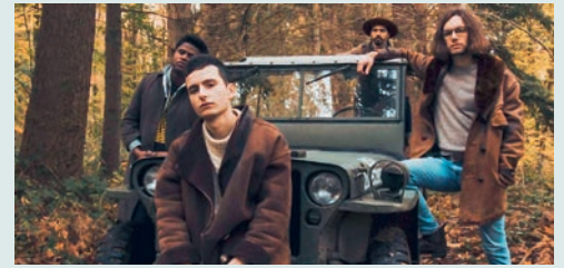
Les Guetteurs aus Frankreich