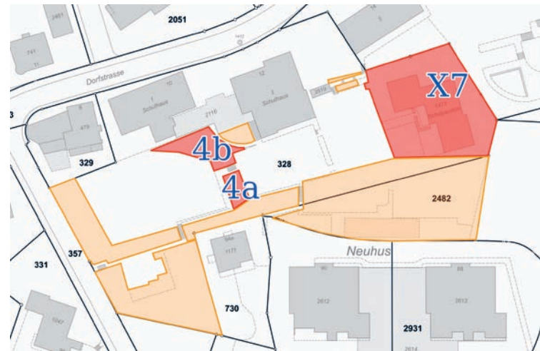
Die gelben Flächen sind bereits vergeben, die roten Flächen 4b, 4a und X7 stehen noch für eine Zwischennutzung zur Verfügung.