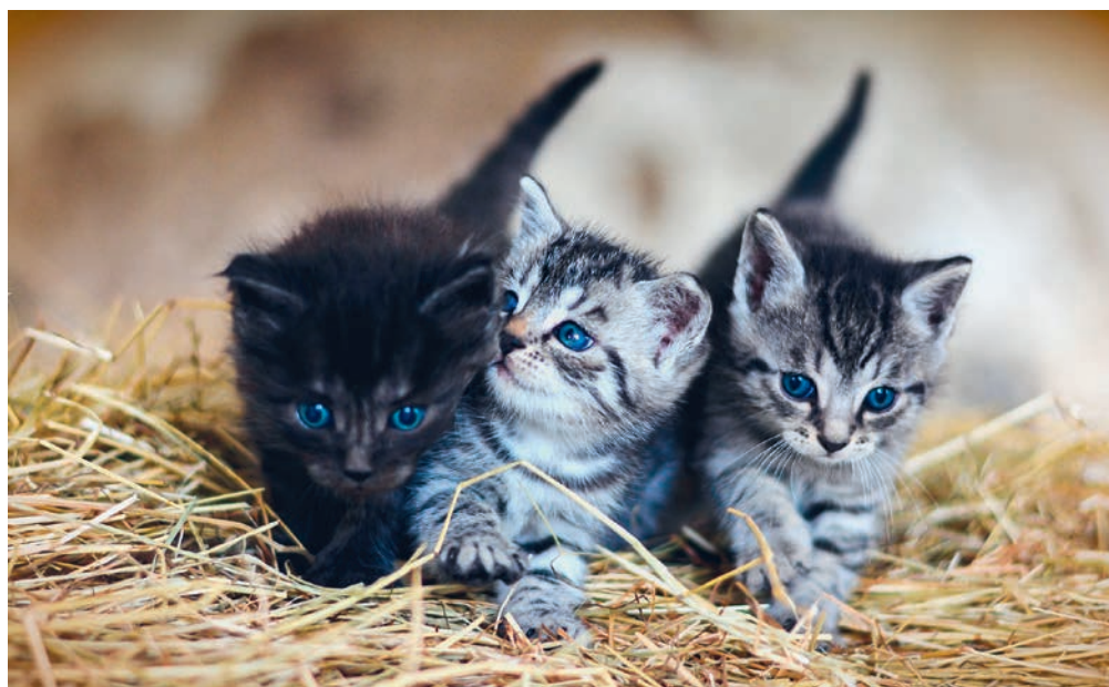
Katzen können pro Wurf über sechs Junge bekommen.