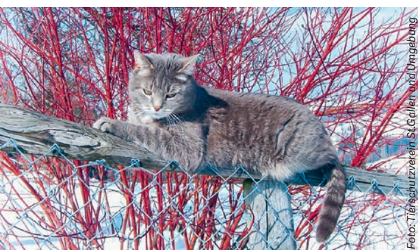
Im vergangenen Jahr wurden in Wittenbach drei wilde Katzen eingefangen, sterilisiert und wieder freigelassen.

stützen die Kastration mit Gutscheinen für den Tierarzt, hauptsächlich für die Landwirte, aber auch für finanzschwache Tierhalter*innen wie zum Beispiel Alleinerziehende oder Senioren,