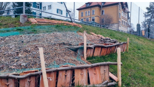
Verschiedene Flächen hat der Gemeinderat bereits an Interessenten vergeben.

Verschiedene grössere und auch kleinere Flächen hat der Gemeinderat somit an Interessierte vergeben. So wird beispielsweise eine der grössten Flächen landwirtschaftlich genutzt, da diese verfügbare Fläche an eine bereits landwirtschaftlich bewirtschaftete