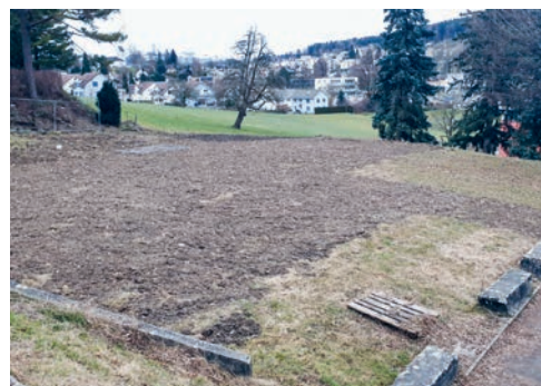
Auch für diese Fläche können für die Zwischennutzung nun Ideen eingegeben werden.