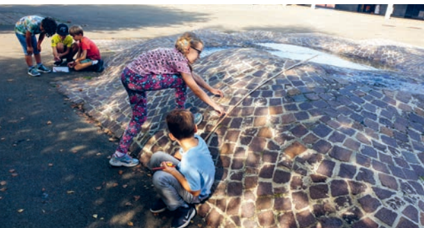
Die Kinder lernen ihren Pausenplatz von einer neuen Seite kennen.