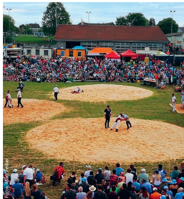
Die Tribünen und Sägemehlkreise beim Schwingfest 2018 in Lengwil (TG).

Am 28. November erfolgt in Marbach (SG) durch die Delegierten des St.Galler Kantonalen Schwingerverbandes die offizielle Vergabe des 108. St.Galler Kantonschwingfestes an die Delegation des Organisationskomitees. Da die Gemeinde Wittenbach bereits für 2022 als Ausrichter des «Kantonalen» vorgesehen war – was die Coronapandemie verhinderte und zur Verschiebung der Veranstaltung um ein Jahr führte –, ist dies ein rein formeller Akt. In einem nächsten Schritt wird eine Website konzipiert, ein offizielles Logo entworfen und – ganz wichtig – das Sponsoring ausgebaut, denn: «Eine wichtige Herausforderung bei ei-