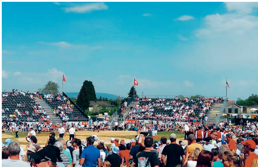
So könnte es 2023 auch in Wittenbach aussehen.