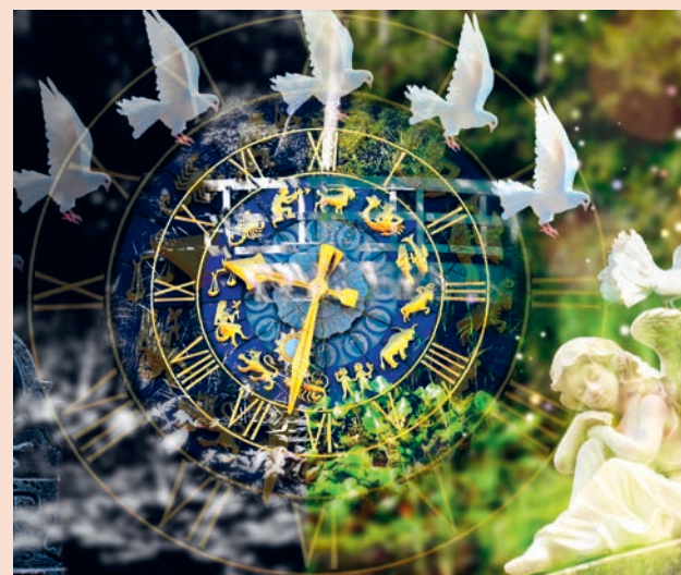
Leben und Tod – Anfang und Ende – Alpha und Omega – Geburt und Sterben – Werden und Vergehen