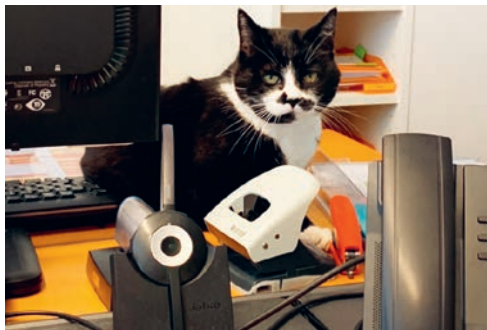
Mittendrin statt nur dabei.