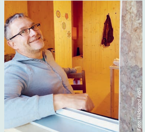
Ein Blick in die Zelle.

Nicht Rückzug, sondern Exponiert-Sein, nicht Leere, sondern Fülle, nicht Alleinsein, sondern ganz für andere da sein – eben ganz im Sinne von: «Erstens kommt es anders, und zweitens als man denkt.»