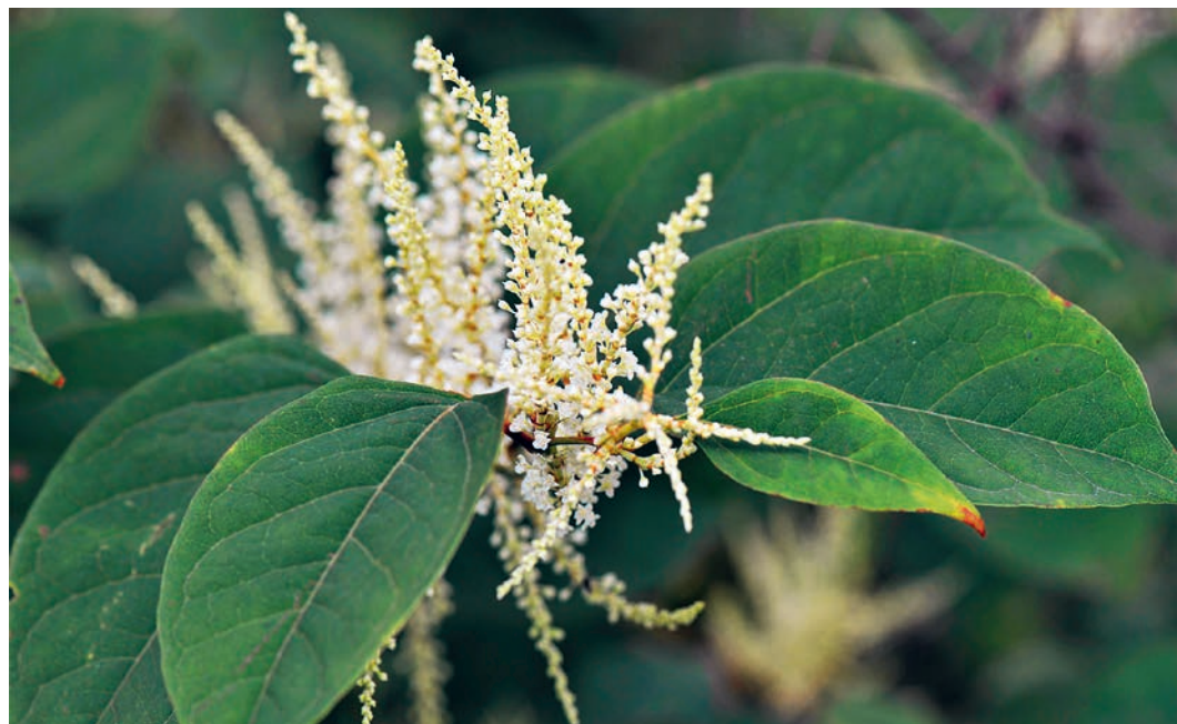
Der unerwünschte Japanische Staudenknöterich.

Bevölkerung Hinweise über grössere Bestände erhalten. Diesen Meldungen gehen wir nach. Je nach Art der Pflanze sieht dann die Bekämpfung anders aus. Die einen Pflanzen können gemäht und via Grünabfall entsorgt werden, andere müssen wir ausgraben und der Kehrichtverbrennung zuführen.