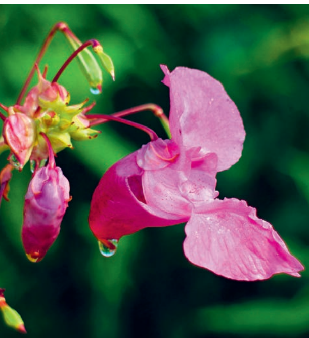
Zwar schön, aber leider problematisch – das Drüsige Springkraut.