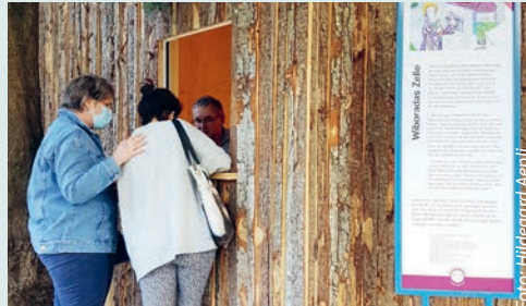
Gespräche am Wiboradafenster.

Am Samstag, 8. Mai, wurde ich eingeschlossen, aber bereits am Sonntag wurde mir klar, dass von Rückzug keine Rede sein kann. Ich war total exponiert und in der Öffentlichkeit. Das täglich offene Fenster wurde sehr in Anspruch genommen, sodass ich in einem umfassenden Sinne beschäftigt war: zuhören, anhören, erklären, diskutieren, informieren, gesegnetes Brot verteilen (Wiborada hat das vor 1100 Jahren auch gemacht!), Fürbitten aufschreiben und natürlich all die vielen Anliegen