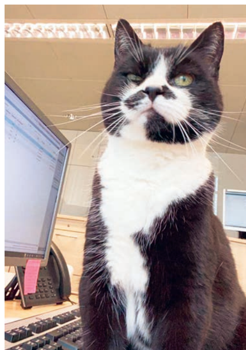
Immer eine helfende Pfote für die Mitarbeitenden im Gemeindehaus.