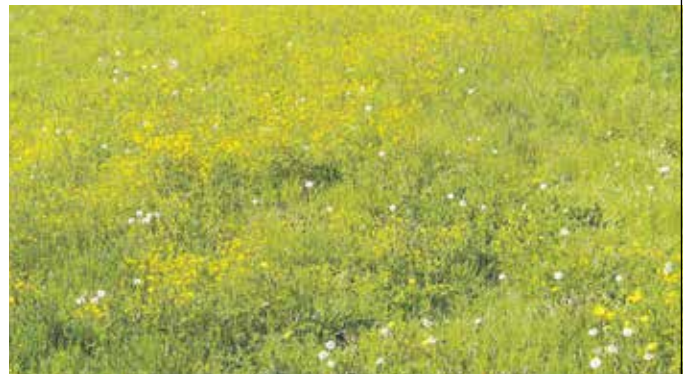
So sieht es auf der Nachbarwiese aus.