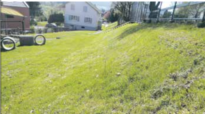
2000 m 2 auf dem ehemaligen Schulanlage Dorf werden so gepflegt, dass sie kaum mehr Bedeutung für die Biodiversität haben, egal ob flache Fläche oder Abhang.

Mit Herzensgrüssen Michel Klein (071 298 27 74)