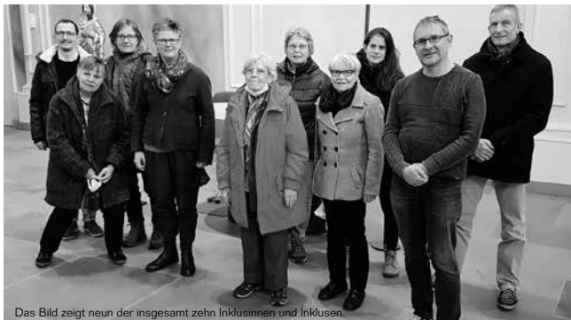
Das Bild zeigt neun der insgesamt zehn Inklusinnen und Inklusen.

Rund um dieses Projekt mit der Klausur gibt es ein vielfältiges Rahmenprogramm über die zehn Wochen verteilt. Unter www.wiberada2021.ch kann dieses abgerufen werden.