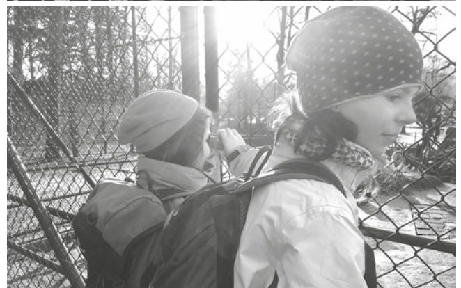
Primarschule Wittenbach, Schulhaus Steig