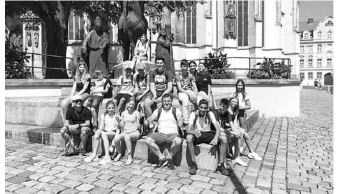
Reise nach Augsburg, Bildnachweis: Sonja Billian

Im Sommer konnte immerhin eine Jugendreise durchgeführt werden, allerdings Corona-konform angepasst. So wurde aus der Elsassreise mit Besuch des Europaparks die Augsburgreise mit Besuch des Skylineparks im Allgäu. Die Jugendlichen fanden es «mega» und hatten einen Riesenplausch.