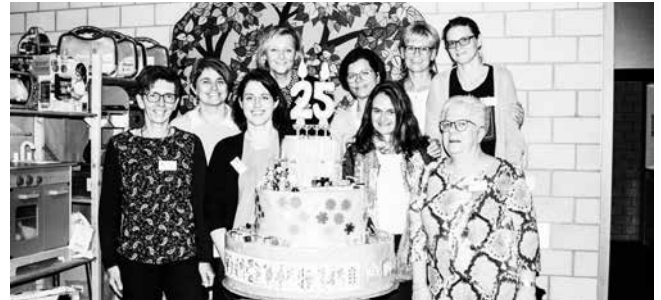
Das motivierte Ludoteam mit der 25-Jahr-Jubiläumstorte