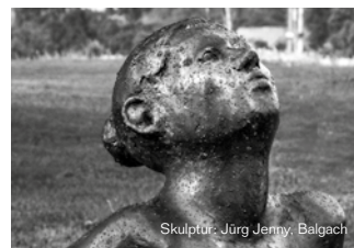
Skulptur: Jörg Jenny, Balgach

Donnerstag, 12. September 2019, 19.00 Uhr