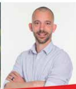
Donat Kuratli Nationalratskandidat St.Gallen