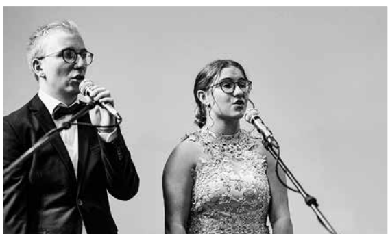
www.gemeindepuls.ch , Filter > Evang.-ref Kirchgemeinde