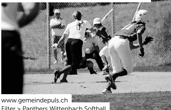
www.gemeindepuls.ch Filter > Panthers Wittenbach Softball