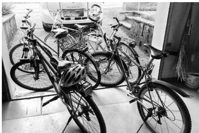
Bild: Velos warten in der Pfarrhausgarage auf den Abtransport

Nach unserem Aufruf «Velos gesucht» im Gemeindepuls vom 16. Mai haben sich mehrere Personen aus Wittenbach und Bernhardzell gemeldet, die Velos zugunsten des Velofahr- und Flickkurses für Flüchtlinge, Migrantinnen und Migranten schenken möchten. Auf diese Weise sind nun 15 Velos zusammengekommen.