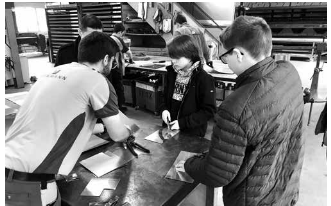
Schneiden eines Bleches.

Berufe direkt in der Praxis kennenlernen: Dazu hat die Eigenmann AG in Wittenbach Schülerinnen und Schüler gemeinsam mit Eltern und Lehrpersonen eingeladen. Der Schnupperevent vom Montagabend war ein voller Erfolg. Bereits zum vierten Mal fand der Schnupperevent in der Firma Eigenmann AG statt. «Fünf auf einen Streich» – ohne