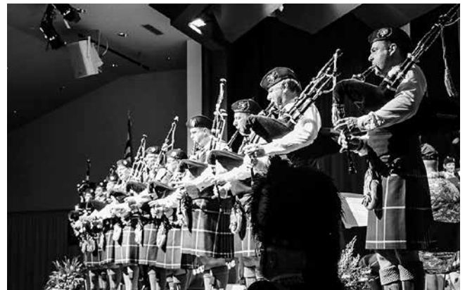
Eher eine Sinfonie als ein Monsterkonzert – MGKW und United Maniacs zusammen.

Die bald folgende grosse Pause, in welcher Plaudern, Küche, Trank und Tombola im Vordergrund standen, wurde mit einem lauten, fremdartigen Kommandoruf beendet – dann setzte sich gemessenen Schrittes längs durch den Saal ein endlos anmutender Zug von 21 Dudelsack-Bläser(inne)n und Schlagwerkern Richtung Bühne in Bewegung, angeführt vom Tambourmajor mit Bärenfellmütze, gezwirbeltem Schnauz, Kranzbart und mächtigem Dirigierstab – alles eine Augenweide. Nun zeigten die preisgekrönten «United Maniacs» mit unterschiedlichsten Stücken und einer raffinierten Solonummer der Trommler die Bandbreite der traditionsreichen schottischen Musik. Der Applaus, der auch dem Erscheinungsbild der Truppe galt, hielt lange an, trotz einzelner sehr lauter Passagen in ihrem Vortrag. Gehörschutze lagen ja auf. Mit einem schmissigen «Hawaii 5-0» riss die Musikgesellschaft dann die Aufmerksamkeit