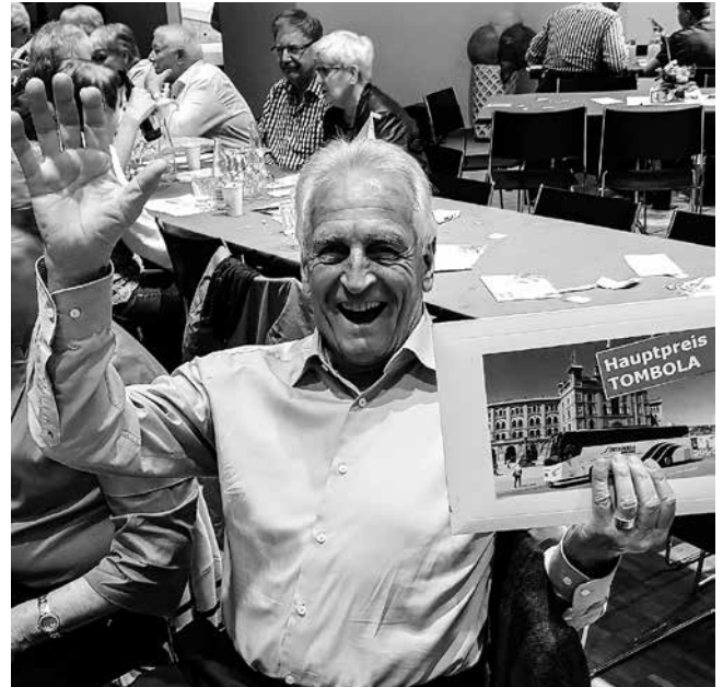
Freut sich auf eine grosse Reise. Der Tombola-Hauptpreis-Gewinner