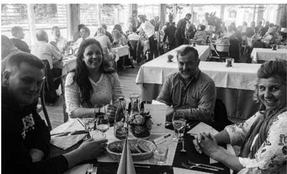
www.gemeindepuls.ch , Filter > Katholische Kirchgemeinde