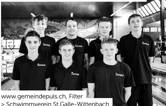
www.gemeindepuls.ch , Filter > Schwimmverein St.Galle-Wittenbach