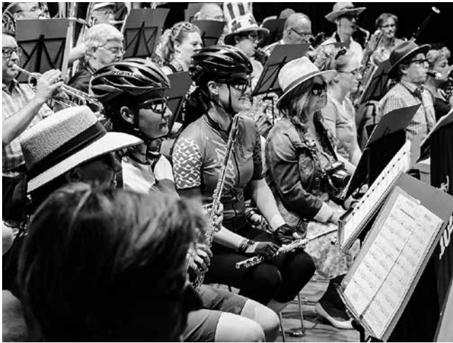
So individuell wie jedes Fernweh – Tenuvarianten am UK 2019.