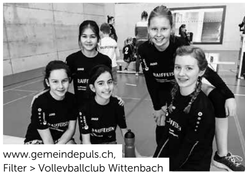
www.gemeindepuls.ch , Filter > Volleyballclub Wittenbach