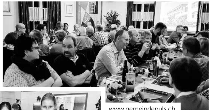
www.gemeindepuls.ch , Filter > Verkehrsverein Wittenbach