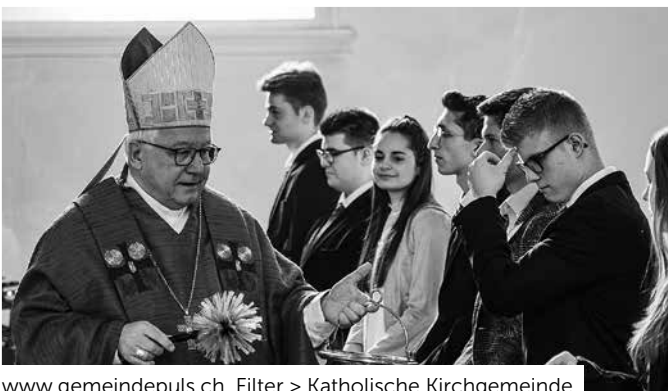
www.gemeindepuls.ch , Filter > Katholische Kirchgemeinde