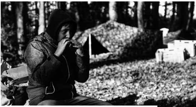
www.gemeindepuls.ch , Filter > Jungschar Wittenbach