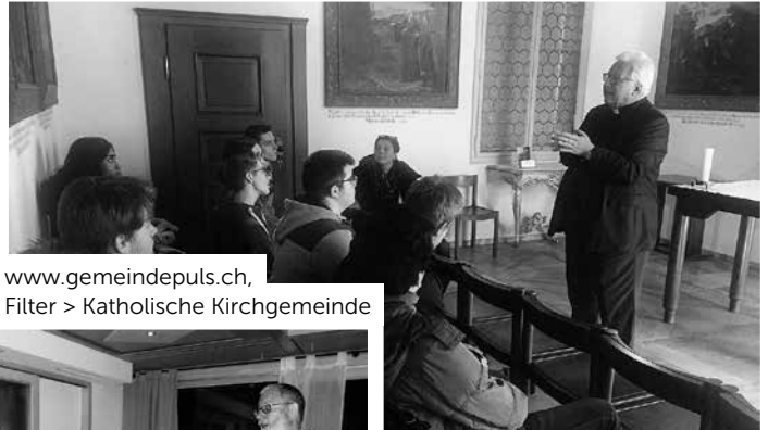
www.gemeindepuls.ch , Filter > Katholische Kirchengemeinde