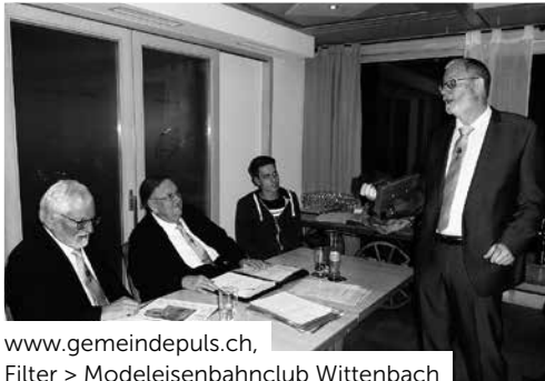
www.gemeindepuls.ch , Filter > Modelleisenbahnclub Wittenbach