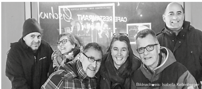
Das ökumenische Team am 6. Februar gemeinsam im Zwingli-Film.