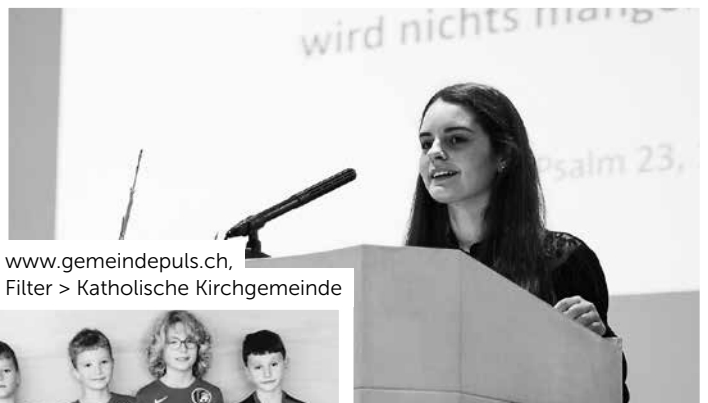
www.gemeindepuls.ch , Filter > Katholische Kirchgemeinde