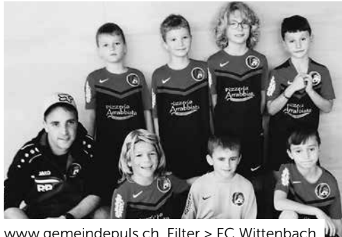
www.gemeindepuls.ch , Filter > FC Wittenbach