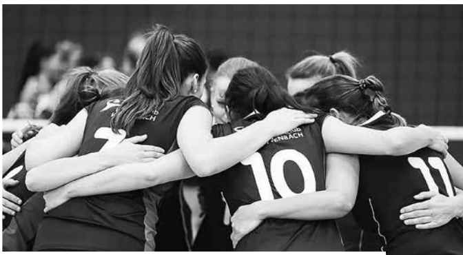
www.gemeindepuls.ch , Filter > Volleyballclub Wittenbach