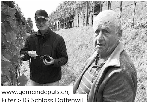
www.gemeindepuls.ch , Filter > IG Schloss Dottenwil