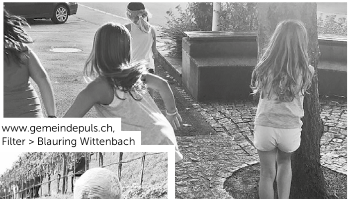
www.gemeindepuls.ch , Filter > Blauring Wittenbach