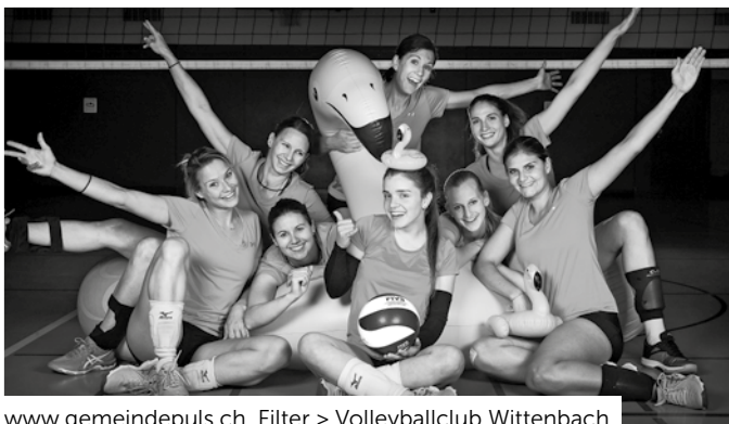
www.gemeindepuls.ch , Filter > Volleyballclub Wittenbach

Alle aktuellen News deines Wittenbacher Lieblingvereins Wo & wann immer du willst: www.gemeindepuls.ch