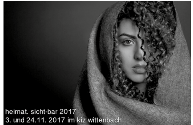
heimat. sicht-bar 2017 3. und 24.11. 2017 im kiz wittenbach

Im Anschluss gibt es einen einfachen Zmittag im Kirchenzentrum. Ihre Anmeldung zum Essen hilft uns beim Planen. Melden Sie sich auch, wenn Sie etwas zum Dessert beitragen wollen (071 298 40 42).