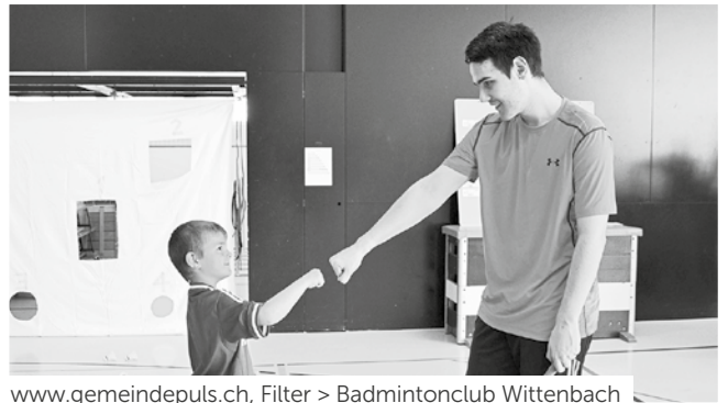
www.gemeindepuls.ch , Filter > Badmintonclub Wittenbach