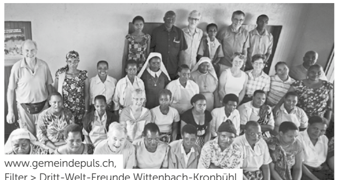
www.gemeindepuls.ch , Filter > Dritt-Welt-Freunde Wittenbach-Kronbühl

Wo & wann immer du willst: www.gemeindepuls.ch