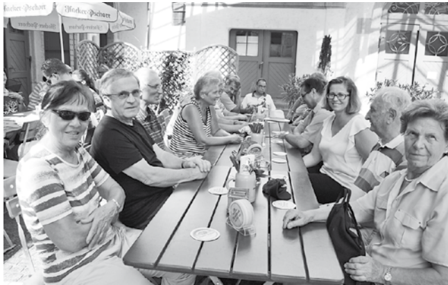
Ausflug nach Regensburg