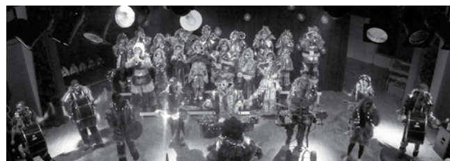
Text und Bilder: Patrick Sutter

Nun geht es einige Monate bis wir nach der Olma wieder zu proben beginnen. Übrigens suchen wir stets nach neuen Gesichtern in unseren Reihen. Falls du ein Teil der Guggenfamilie werden möchtest und ein Instrument spielst, melde dich doch sofort bei uns.