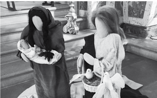
Text und Bilder: Christian Leutenegger

So werden die Gottesdienste Anfang Februar in St.Ulrich und St.Konrad immer ganz festlich. Dabei geben die Kerzen bei der Lichterprozession den Feiern einen ganz besonderen Glanz.