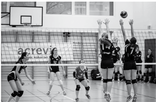
www.gemeindepuls.ch , Filter > Volleyballclub Wittenbach