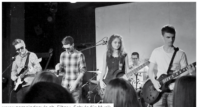
www.gemeindepuls.ch , Filter > Schule für Musik