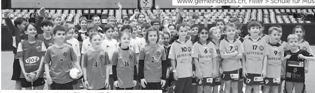
www.gemeindepuls.ch , Filter > HC Rover Wittenbach