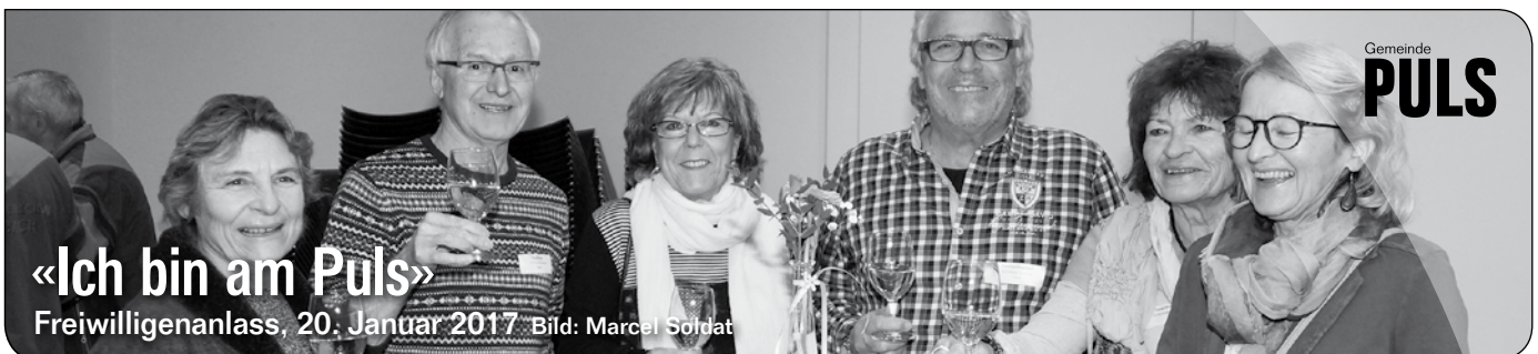
Text und Bilder: Christian Leutenegger

Zusätzlich wurde in den Gottesdiensten am Wochenende Brot gesegnet, das die Leute zur Weihe in die Kirche mitbrachten.