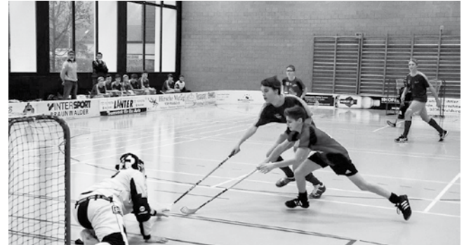
Resultate vom 27.11.2016 in Wittenbach SG: 1.Spiel: STV Wittenbach – UHC Flying Penguins Niederwil, 2:8 (0:5), 2.Spiel: STV Wittenbach – UHC Zuzwil-Wuppenau, 4:4 (2:0)

den Wittenbachern nicht, den Gegner entscheidend zu distanzieren. Mit dem Willen, doch noch ein positives Resultat zu erzielen, gelang dem STV der vielumjubelte Ausgleich 30 Sekunden vor Schluss. Das Unentschieden kam jedoch einer Niederlage gleich, hatte man doch beim STV viel mehr erhofft. Trotzdem blicken die Wittenbacher Junioren inklusive Trainer motiviert ihren nächsten Aufgaben entgegen.