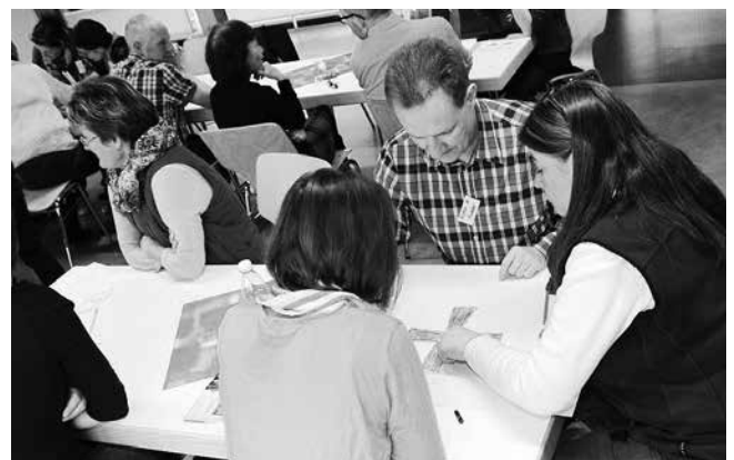
Text und Bilder: M. Keller