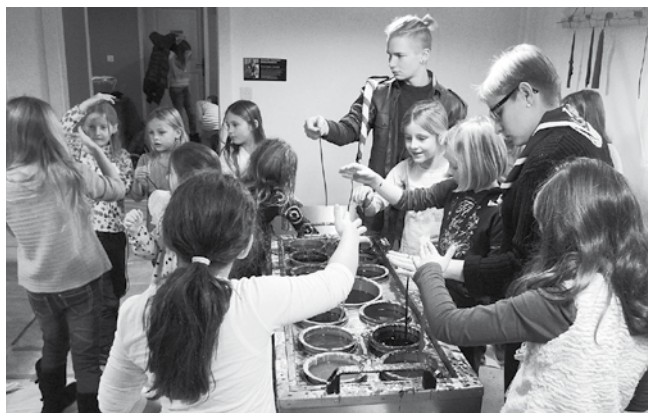
Text und Bild: F. Schetter

Was gibt es Schöneres als die Adventszeit mit einem stimmungsvollen Sonntag im Schloss zu beginnen? Zum 13. Mal wird das Bistro in ein farbenfrohes Kerzenzieh-Paradies verwandelt. Klein und Gross kann sich mit der 12-Farben-Kerzenküche vergnügen. Vorweihnachtliche Düfte feiner Speisen wehen durch die Schlossgänge und laden zum gemütlichen Beisammensein im Saal ein. Herzlich willkommen – Wir freuen uns auf Ihren Besuch! www.pfadipeterpaul.ch