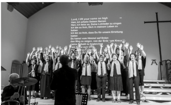
www.gemeindepuls.ch , Filter > Gospelchor Wittenbach