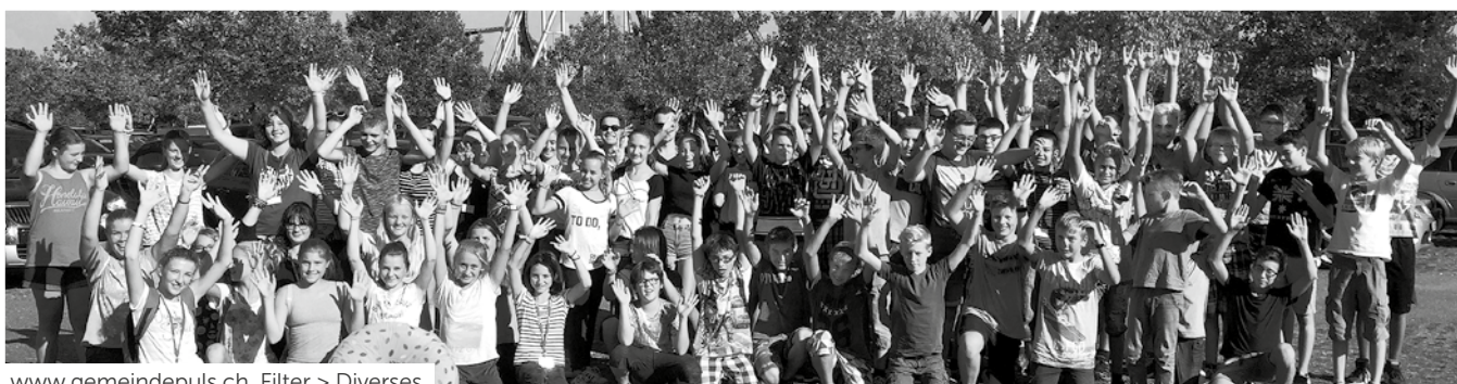
www.gemeindepuls.ch , Filter > Diverses