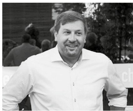
www.gemeindepuls.ch , Filter > FDP Wittenbach-Muolen