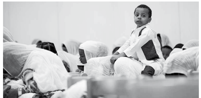
Text: Christian Leutenegger; Bilder: Kurt Merz

Dieser Ausspruch von Jesus in der Bibel ist in den Gottesdiensten der äthiopisch-orthodoxen Kirche hautnah zu erleben. Überall turnen und wuseln Kinder herum und geben dem Gottesdienst und dem ganzen Drum und Dran ein noch lebendigeres Gepräge, wie der Anlass eh schon hat. Zweimal im Jahr ist diese afrikanische Konfession bei uns im Kath. Kirchenzentrum St. Konrad zu Gast. Und die Freude ist immer gross, wenn auch Schweizer Gäste auftauchen und mitfeiern und mitessen. Im Februar 2017 ist die nächste Gelegenheit.