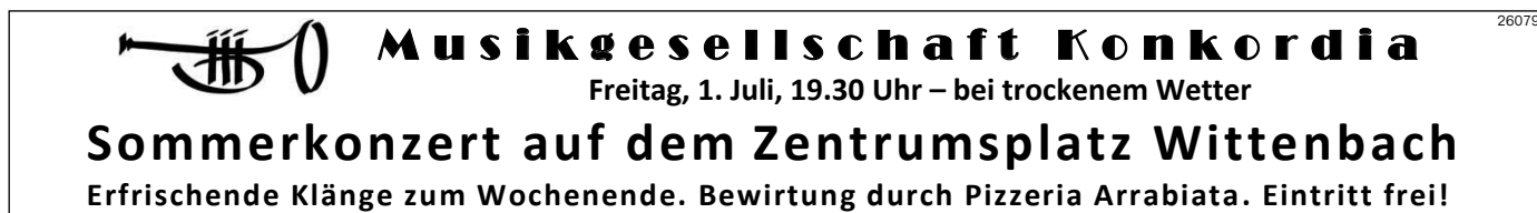
Text und Bild: PPA

Die Zusammenarbeit der PP Autotreff AG mit den St. Galler Festspielen ist insofern wichtig für die Region, als die St. Galler Gemeinde mit dem repräsentativen Neubau des Audi-Terminals in Wittenbach die modernste Audi- und VW-Vertretung der Region bekommt. Mit Bezug der neuen Räumlichkeiten im Herbst 2016 wird das Wittenbacher Familienunternehmen strategischer Partner der AMAG-Gruppe für alle VW- und Audi Modelle. Mit der Investition werden langfristig nicht nur 25 neue Arbeitsplätze in der Region, sondern auch mehr Raum für die Dienstleistungen der PP Autotreff AG geschaffen. Dazu gehören nebst den üblichen Serviceleistungen auch ein exklusiver Audi-R8-Stützpunkt und eine hauseigene Malerei- und Spenglerwerkstatt.