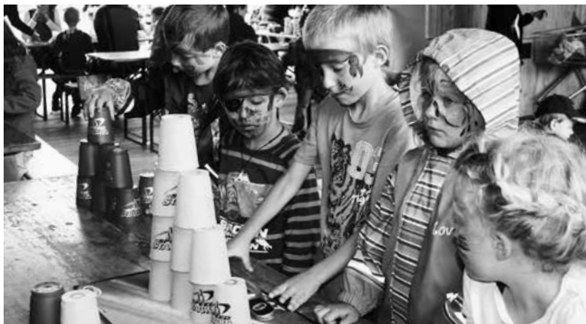
Text und Bilder: Annemarie Spierings-Lichti

Es hat sehr viel Spass gemacht mit euch! Jedes Kind konnte sich schminken lassen, wenn es wollte. Ein kleines Andenken habt ihr gebastelt! Zudem konntet ihr viele Sachen ausprobieren! Auch unser Kaffe- und Kuchenbuffet fand grossen Anklang! Ich hoffe, dass alle Spass hatten und fröhlich und zufrieden den Heimweg antreten konntet! Euer Fami-Team