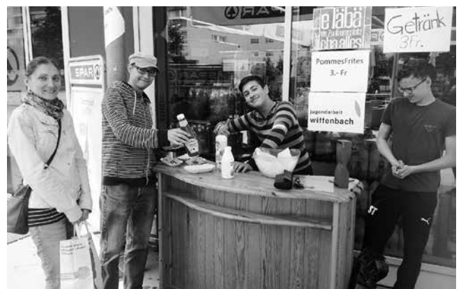
Foto: 11. Juni, Pommes-Verkaufsstand Spar

16.00–20.00 Uhr: «Chillen» mit einem Verkaufsstand