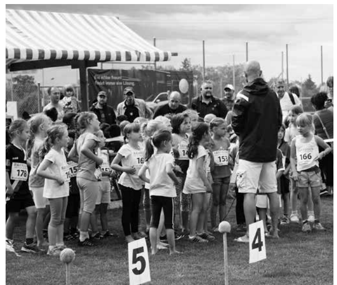
OK Dä schnällscht Wittebacher

Die Läufe der Kategorien Knaben 09/10, Mädchen 11/12 und Knaben 11/12 konnten nicht mehr durchgeführt werden.