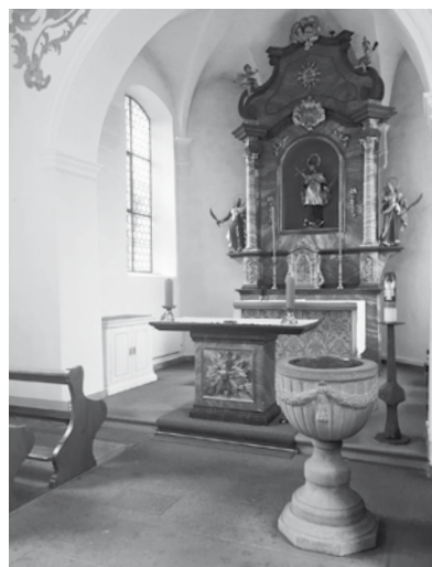
Bild: In der Nepomuk-Kapelle auf dem Ulrichsberg steht der Taufstein. Hier finden in Wittenbach die meisten katholischen Tauffeiern statt.

Melden Sie sich doch einfach unverbindlich bei uns und wir klären mit Ihnen die Möglichkeiten.